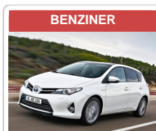
Toyota Auris 1.8 Hybrid Executive, 100 kW, 5-türig (Super) **