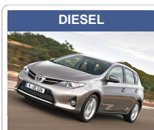
Toyota Auris 2.0 D-4D Executive, 91 kW, 5-türig (Diesel) **